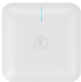
cnPilot e410 Enterprise Indoor Access Point

Intégrant un portail captif gérant les accès au réseau sans fil, la plate-forme permet notamment à Buffalo Grill de définir les étapes du parcours utilisateur, la page d'identification, le questionnaire de satisfaction, etc. lors de chaque connexion. Elle permet aussi d'établir des statistiques sur le volume de trafic et le profil de la clientèle (âge, genre, pays d'origine, etc.).